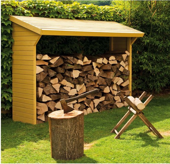
modèle vendu non peint - model sold unpainted